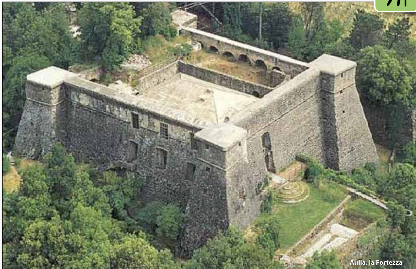
Aulla, la Fortezza

PARTENZA CON AUTO PROPRIE: ORE 8.30 DA PRATO, PIAZZALE DEL TRIBUNALE Percorso in auto Km 135 - h. 1.40: Prato > A11 > A12 > A15 > Aulla AD AULLA ORE 10.36 TRENO PER PONTREMOLI