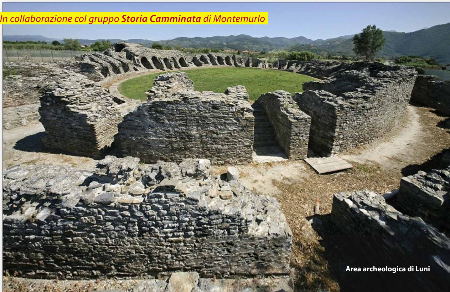
Area archeologica di Luni

In collaborazione col gruppo Storia Camminata di Montemurlo