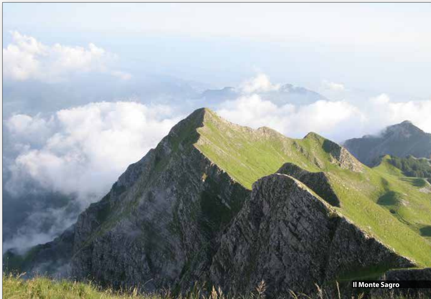
Il Monte Sagro

ORE 6.30 PARTENZA DA PRATO , PIAZZALE DEL TRIBUNALE, CON AUTO PROPRIE ORE 8.00 RITROVO ALLA STAZIONE DI LUCCA, ORE 8.26 PARTENZA IN TRENO - ORE 10.10 ARRIVO A PONTE MONZONE