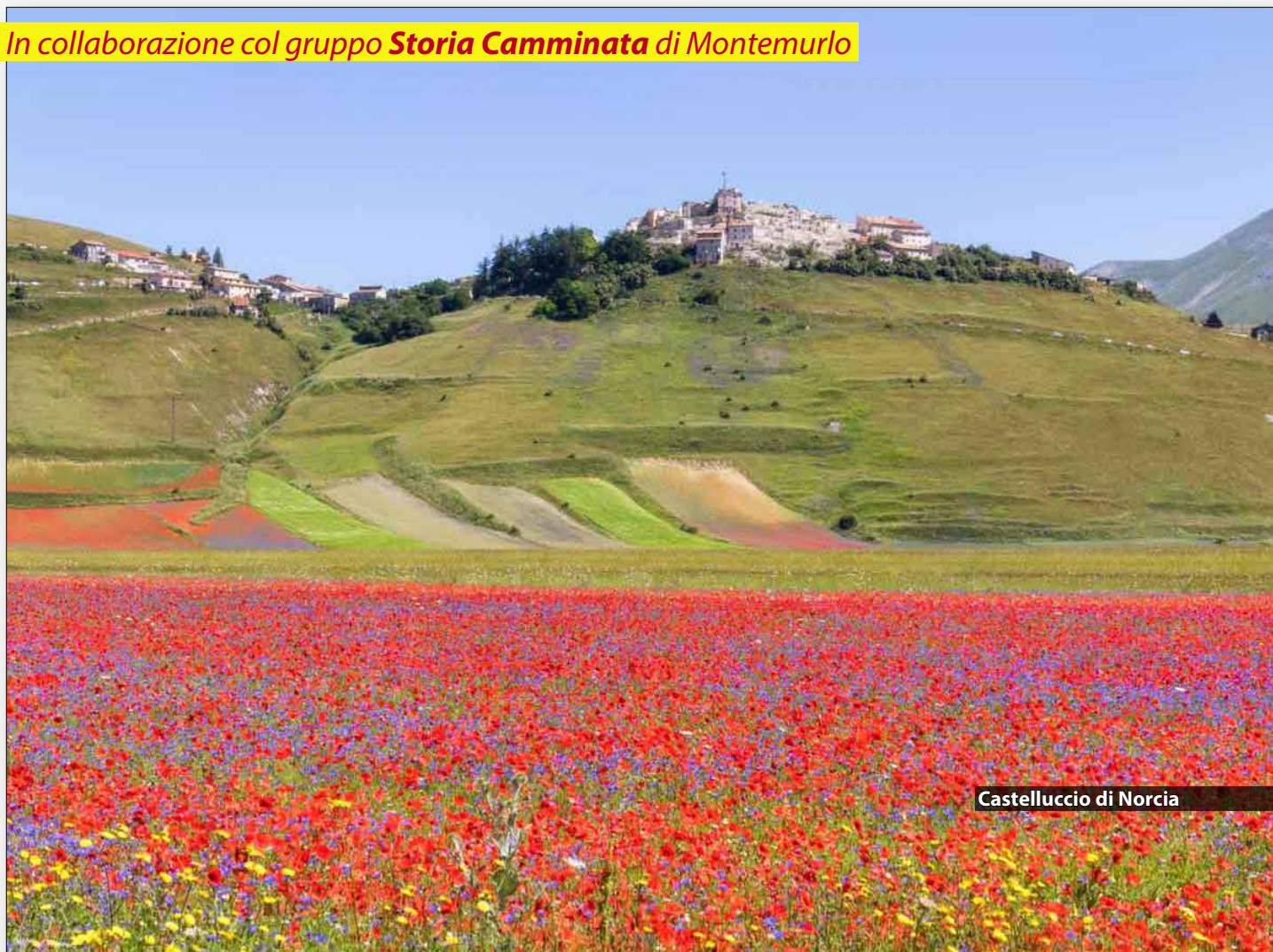
Castelluccio di Norcia

In collaborazione col gruppo Storia Camminata di Montemurlo