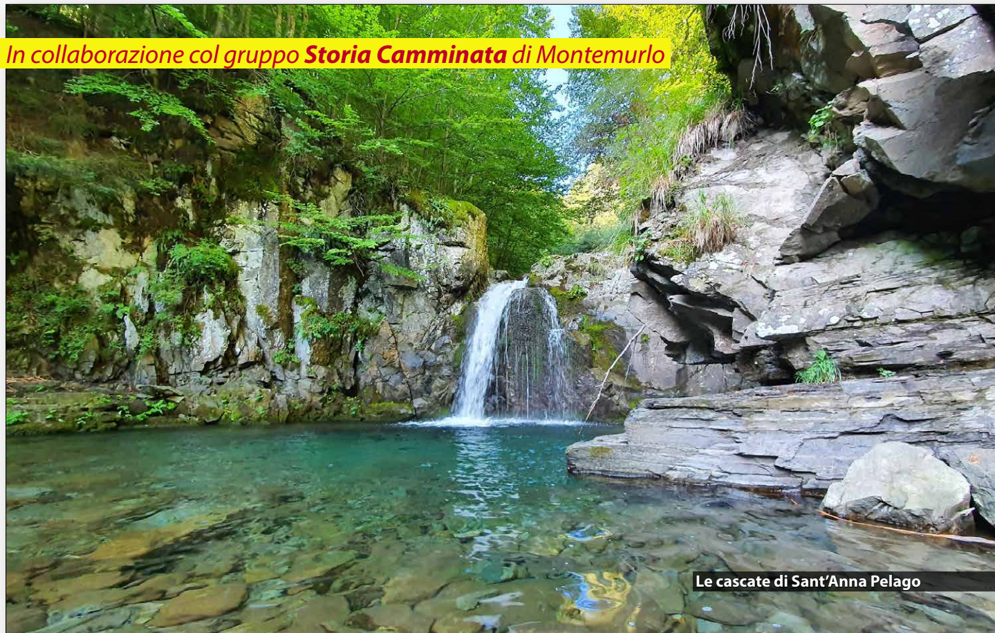
Le cascate di Sant'Anna Pelago

In collaborazione col gruppo Storia Camminata di Montemurlo