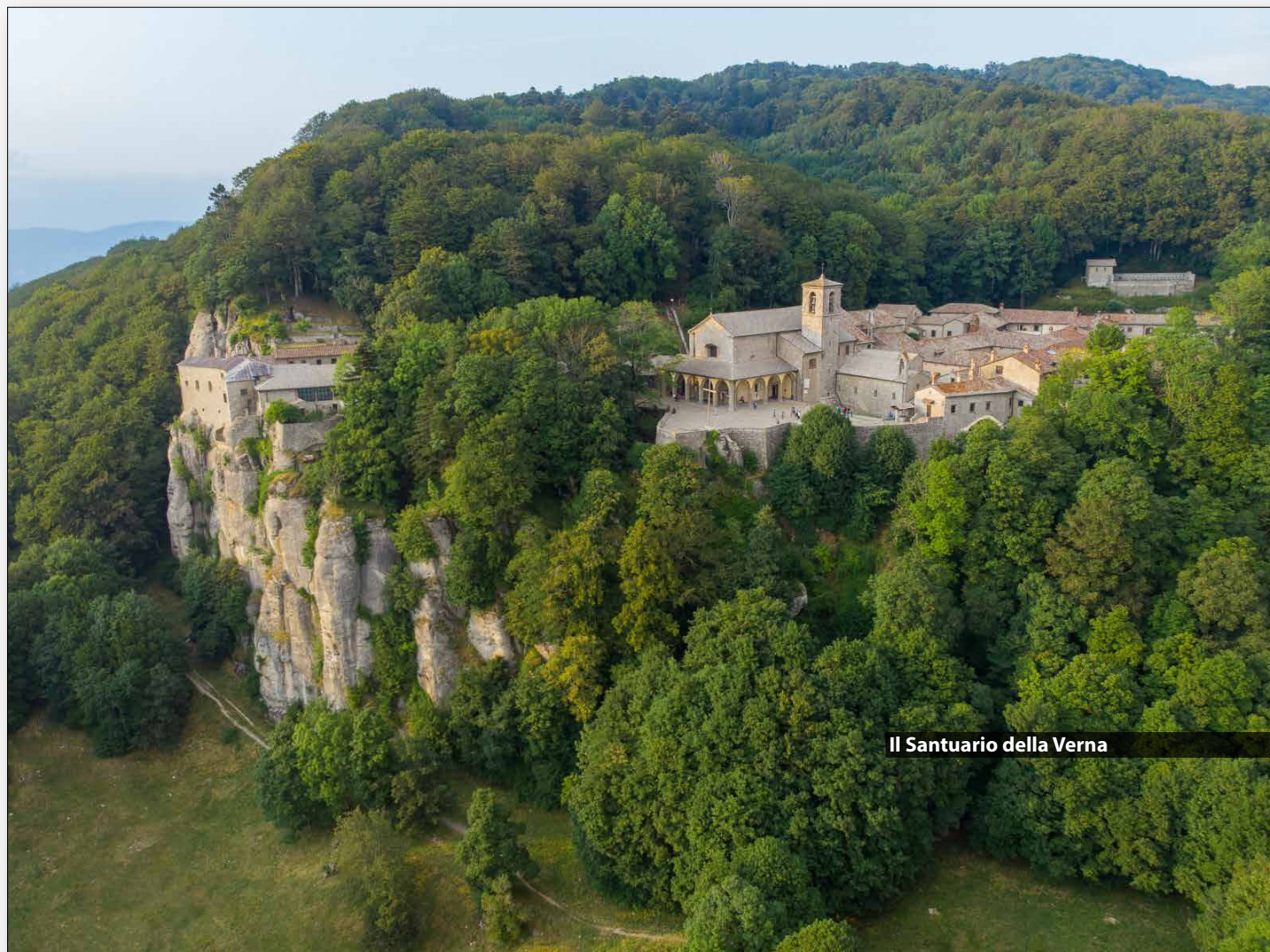
Il Santuario della Verna

PARTENZA CON AUTO PROPRIE ORE 7.00 DA PRATO , PIAZZALE DEL TRIBUNALE Percorso in auto: Km 105 - ore 2.00 circa A11 > A1 > Pontassieve > Consuma > Bibbiena > Chiusi della Verna